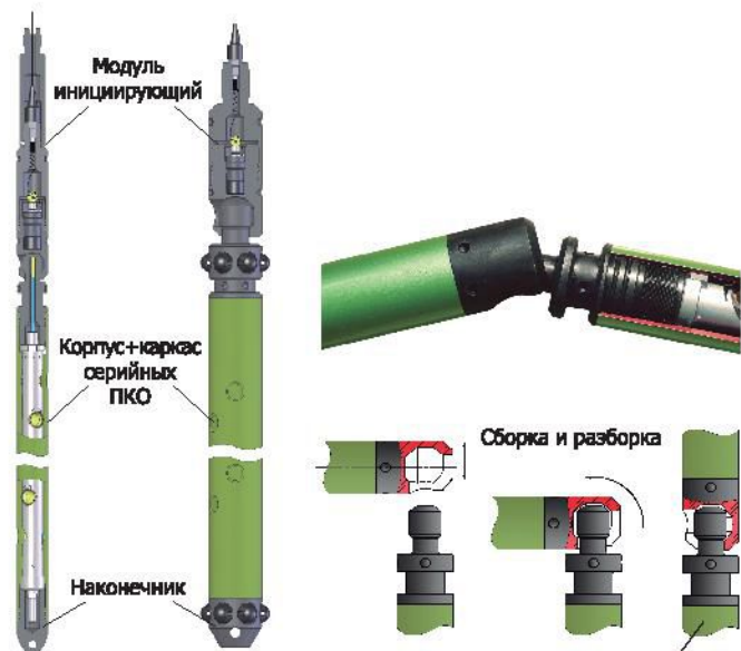
SNAKE в сборке ( \varnothing 50 \pm 114 мм)