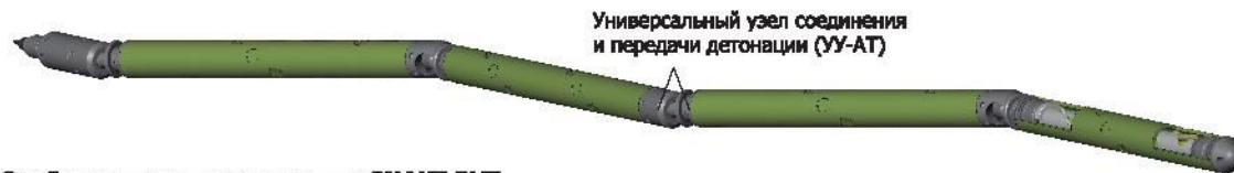
Универсальный узел соединения и передачи детонации (УУ-АТ)